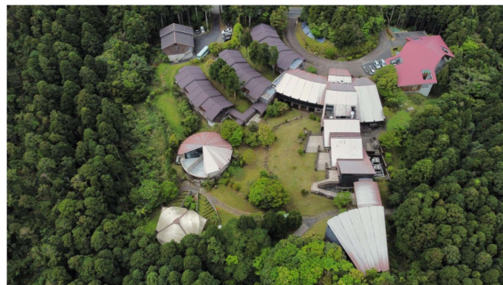
屋久島環境文化研修センター (屋久島町安房)